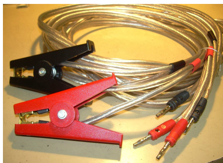
Coppia cavetti KELVIN - cavo L=1,00mt - pinze con apertura max 32mm