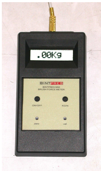
SONDA SM5 (cm)